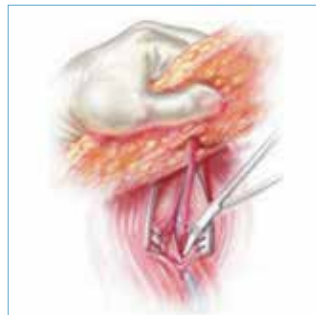
isolamento del peduncolo vascolare e collegamento ai vasi mammari interni