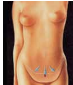
rimozione dell'eccesso cutaneo