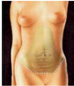
scollamento dell'area cutanea